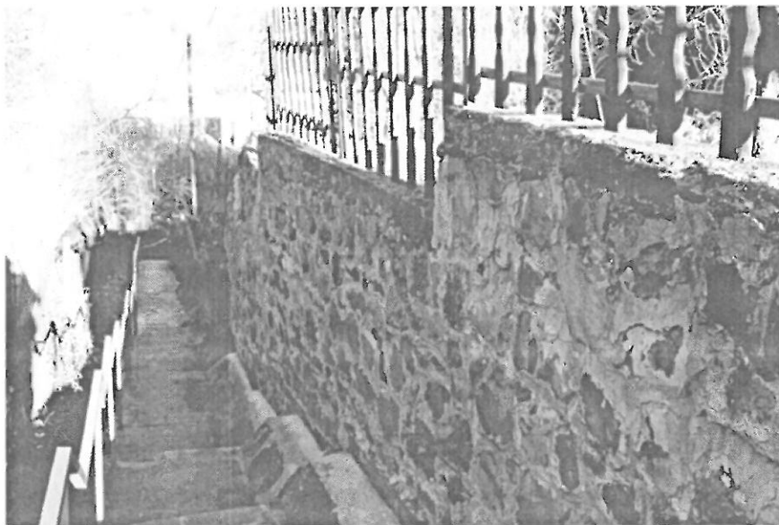
2. sz. kép. A támfal, a lépcsősor, és mellette a burkolt árok.