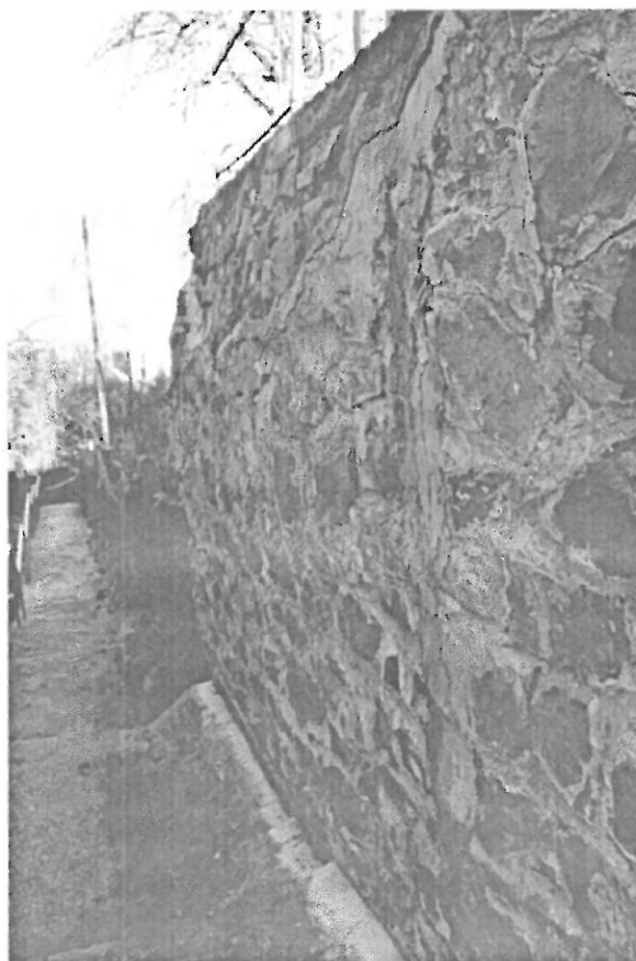
3. sz. kép. A támfal a járda felé dől.

A támfalon víz kivezetés nincs, feltehetően hátszivárgója sincs. A korábbi horhos (természetes vízfolyás) útjába lett építve.